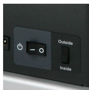
Innen- oder Außenwicklung