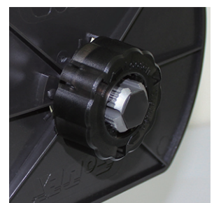
Schelle und sichere Arretierung der Etikettenrollen-Anschlagplatte