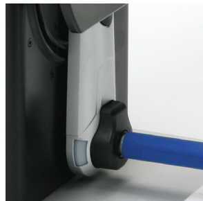
Farbige LEDs zur Statusanzeige des Aufwicklers