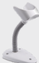
▪ STD-G040-WH: Basic Stand, G040, Weiß