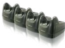
Vierfach Ladestation (Optional Ethernet Anschluss)