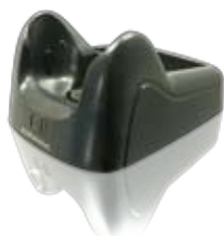
Einfach Ladestation mit Ladeschacht für Ersatzakku (Opt. Ethernet oder Modem Anschluss)